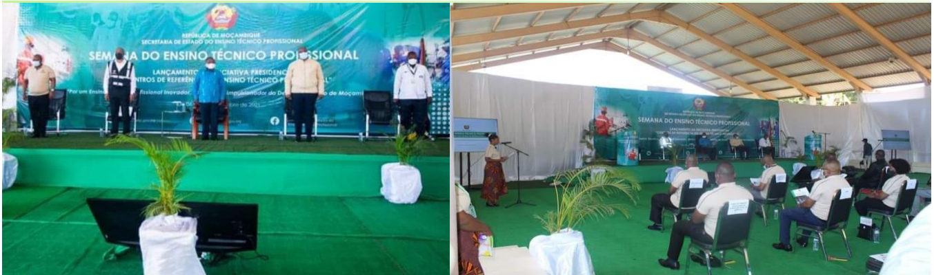
Foto 2 Sua Excia. Pr no Lançamento da iniciativa Presidencial centro de referência no âmbito da Semana Nacional do Ensino Técnico Profissional

formados, correspondente a 20,3%, seguido de Cabo Delgado com 19,7%, enquanto que Zambézia apresenta menor número, representando 3,9%.