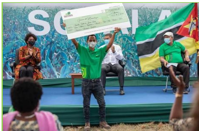
Foto 9 Beneficiários de Créditos agrários