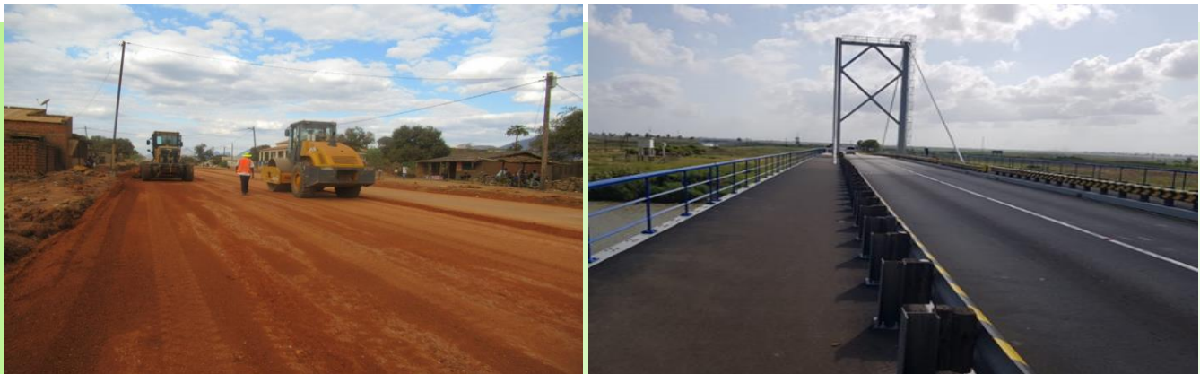
Foto 5 Intervenção das obras públicas nos diferentes construção, asfaltagem e reabilitação de estradas e pontes