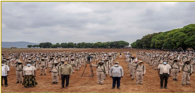
Foto 8 Sua Excia. PR no Lançamento da Campanha Agrícola em Vanduzi, Manica com extensionistas