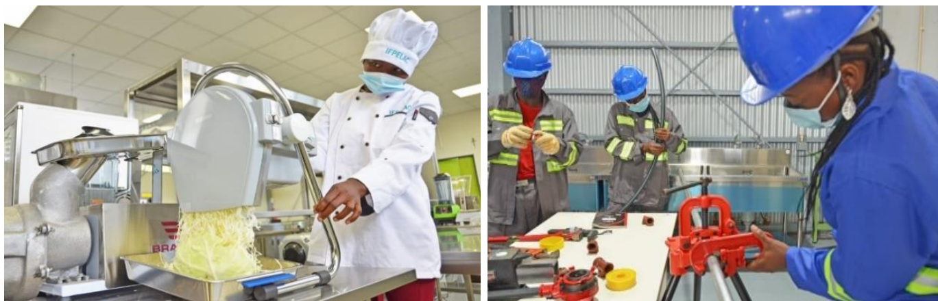
Foto 4 Formandos do Centro de Formação Profissional de Quelimane das áreas de Alimentação e Canalização