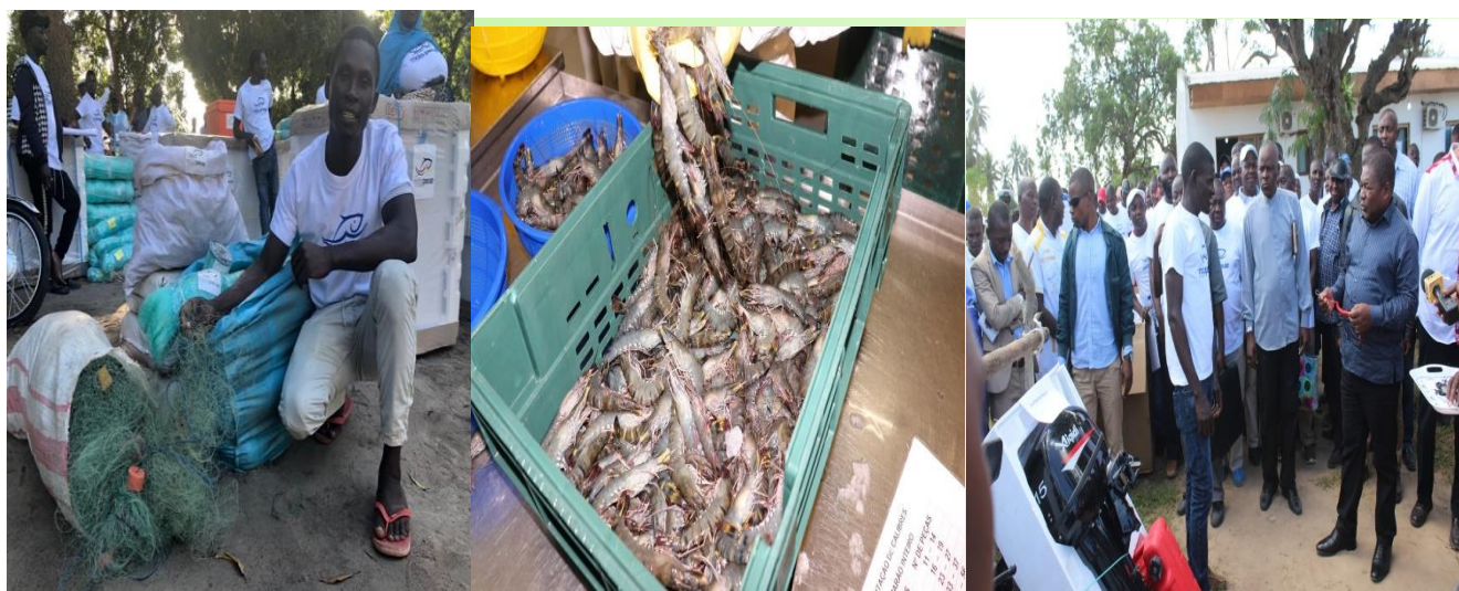
Foto 10 Aquapesca - Desenvolvimento de pesca artesanal e Aquacultura comercial