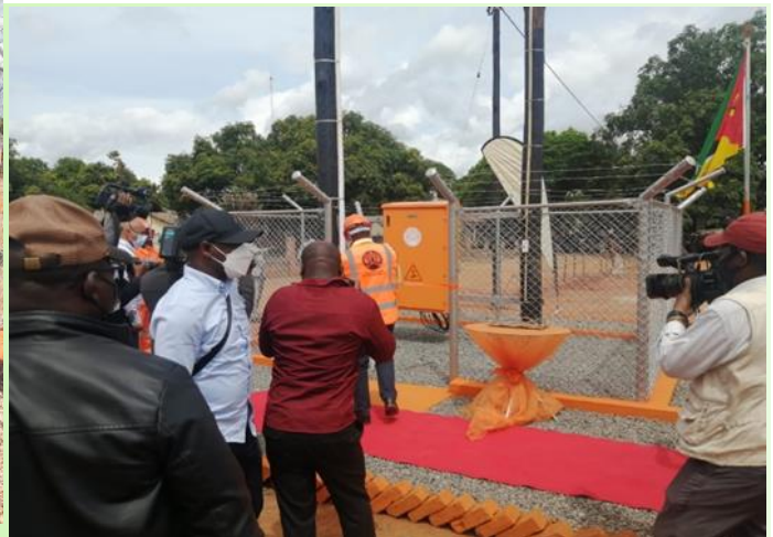
Foto 12 Sua Excia. PR. Inauguração da Rede eléctrica em Mazucane. Gaza artesanal e Aquacultura comercial