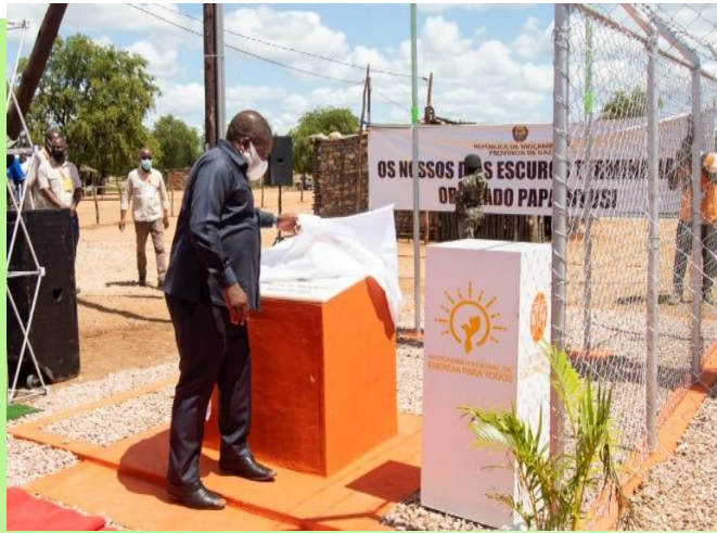
Foto 12 Sua Excia. PR. Inauguração da Rede eléctrica em Mazucane, Gaza artesanal e Aquacultura comercial

Expandida a Rede Eléctrica Nacional (REN) e sistemas isolados expandidos em 22 novos distritos, postos administrativos, vilas e povoados, dos 19 planificados (uma realização acima de 100% ) , designadamente Nauela, Chiraco, Macaloge, Madjedje (Provincia de Niassa), Majawa, Namanjavira (Provincia de Zambezia) Calanga (Maputo), Zinande (Inhambane), Alto Changane, Changanine (Gaza).