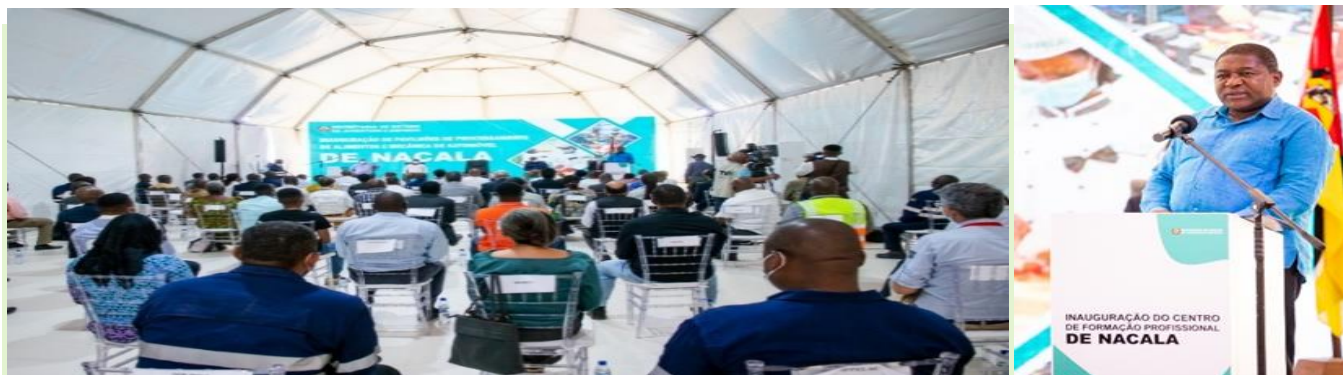
Foto 3 Sua Excia, FILIPE NYUSI, Pr orientando a cerimónia de inauguração de Centro de Nacala