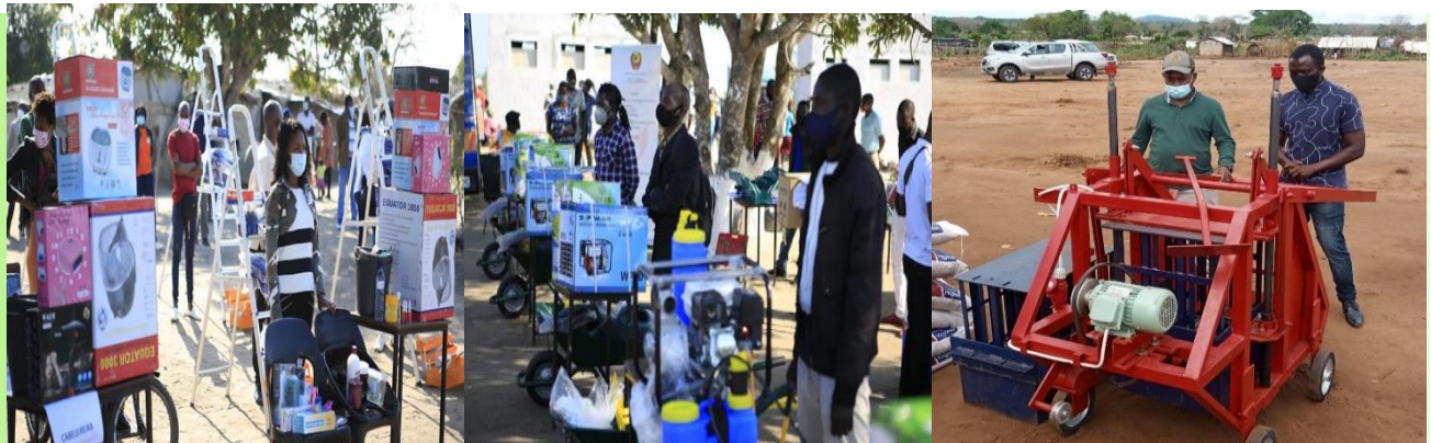
Foto 6 Jovens recebendo Kits de auto-emprego, no âmbito do Programa Meu Kit, Meu Emprego