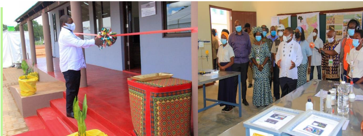
Foto 1 Sua Excia. PR. na Inauguração da Escola Secundária de Carapira, Nampula